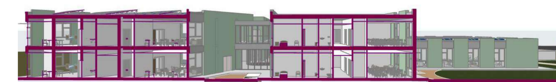
SEZIONE PROSPETTICA 1