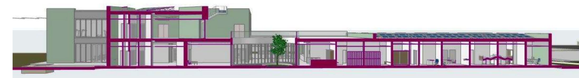
SEZIONE PROSPETTICA 2