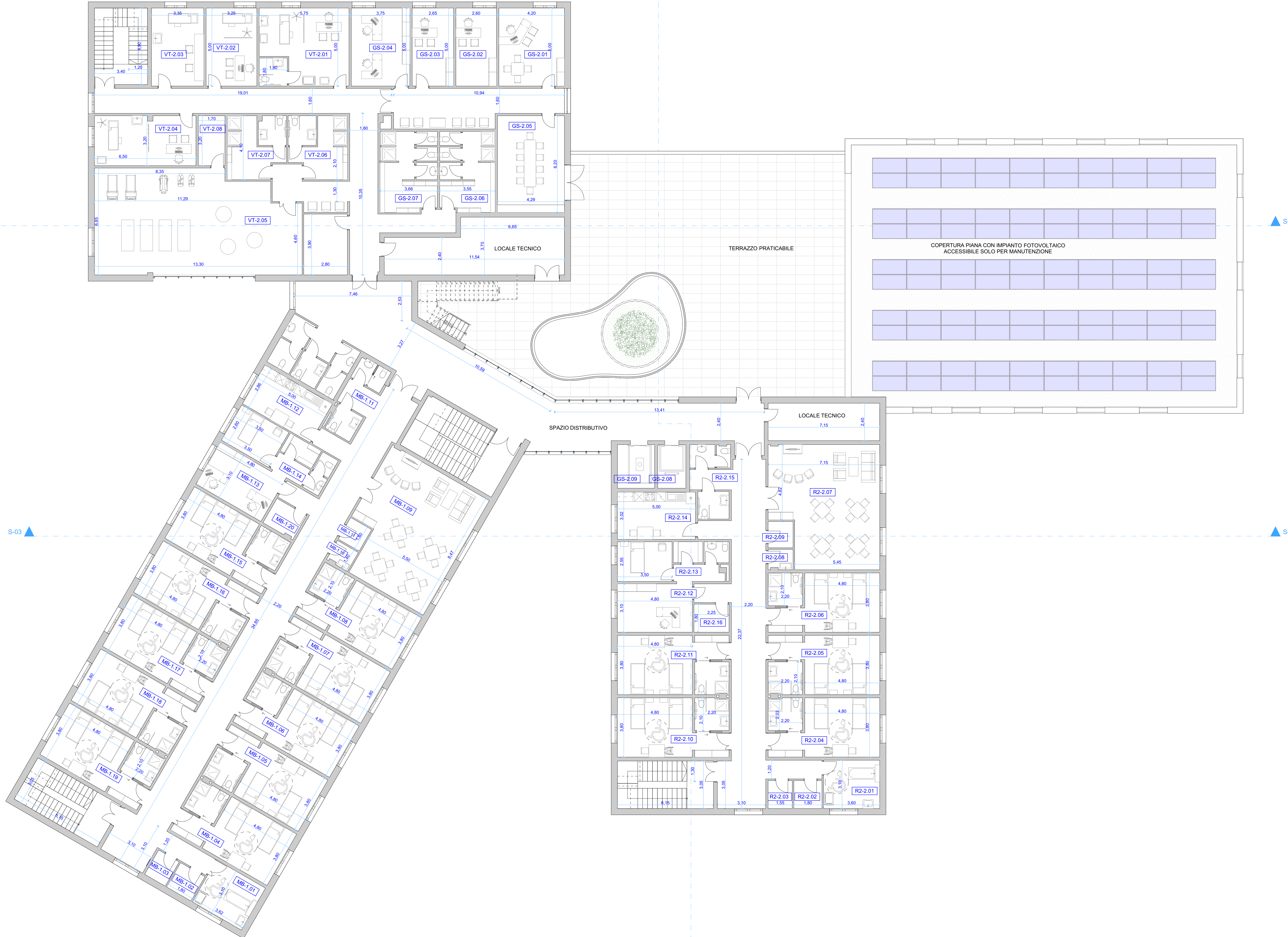
P.04 PLANIMETRIA PIANO PRIMO