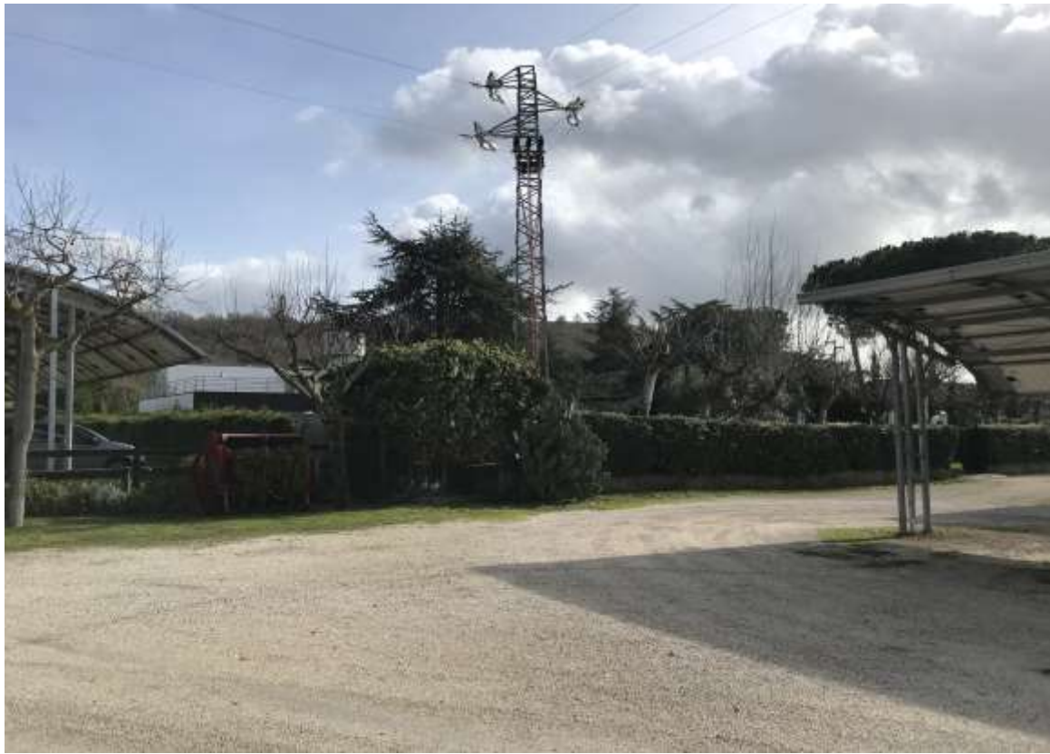
Figura 4 .Dal parcheggio verso la discoteca