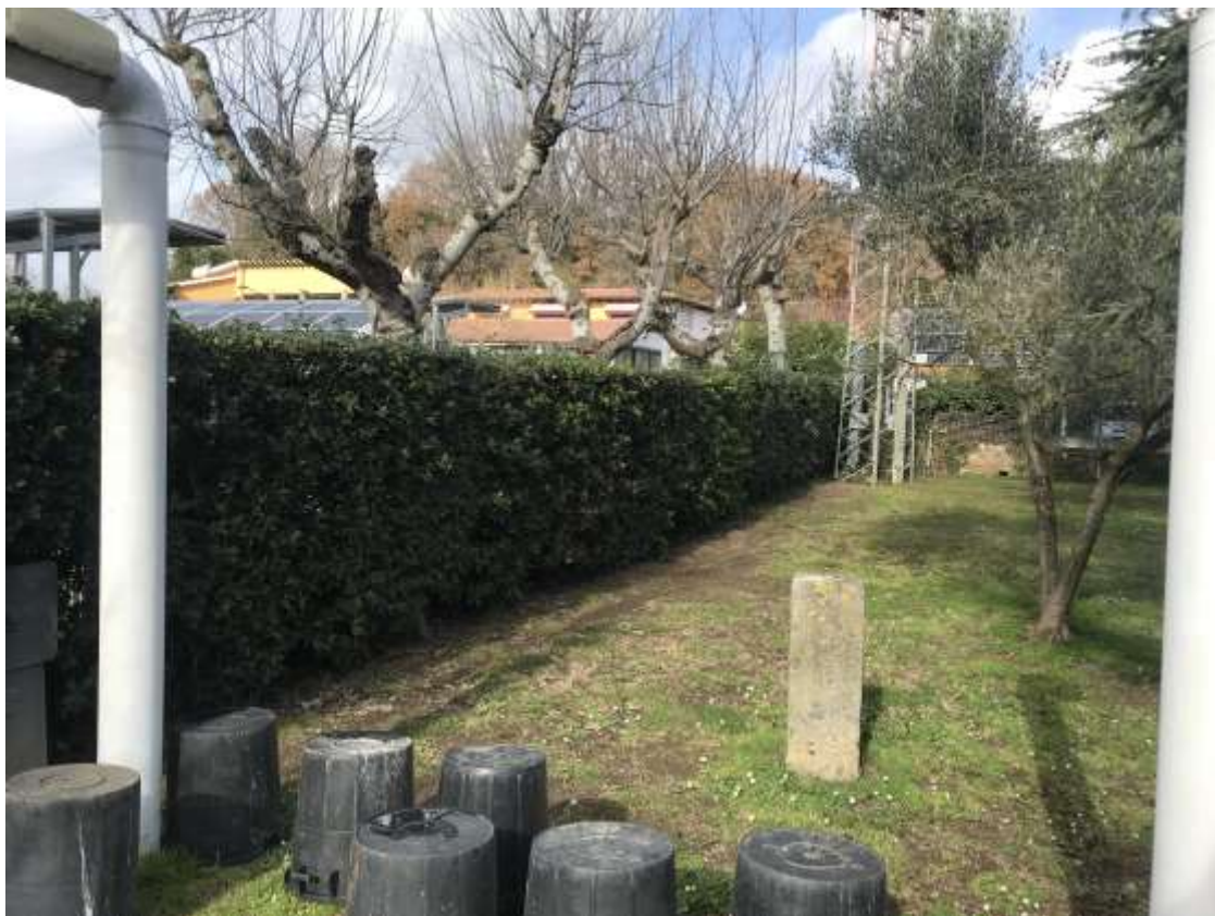
Figura 7. Vista verso il ristorante