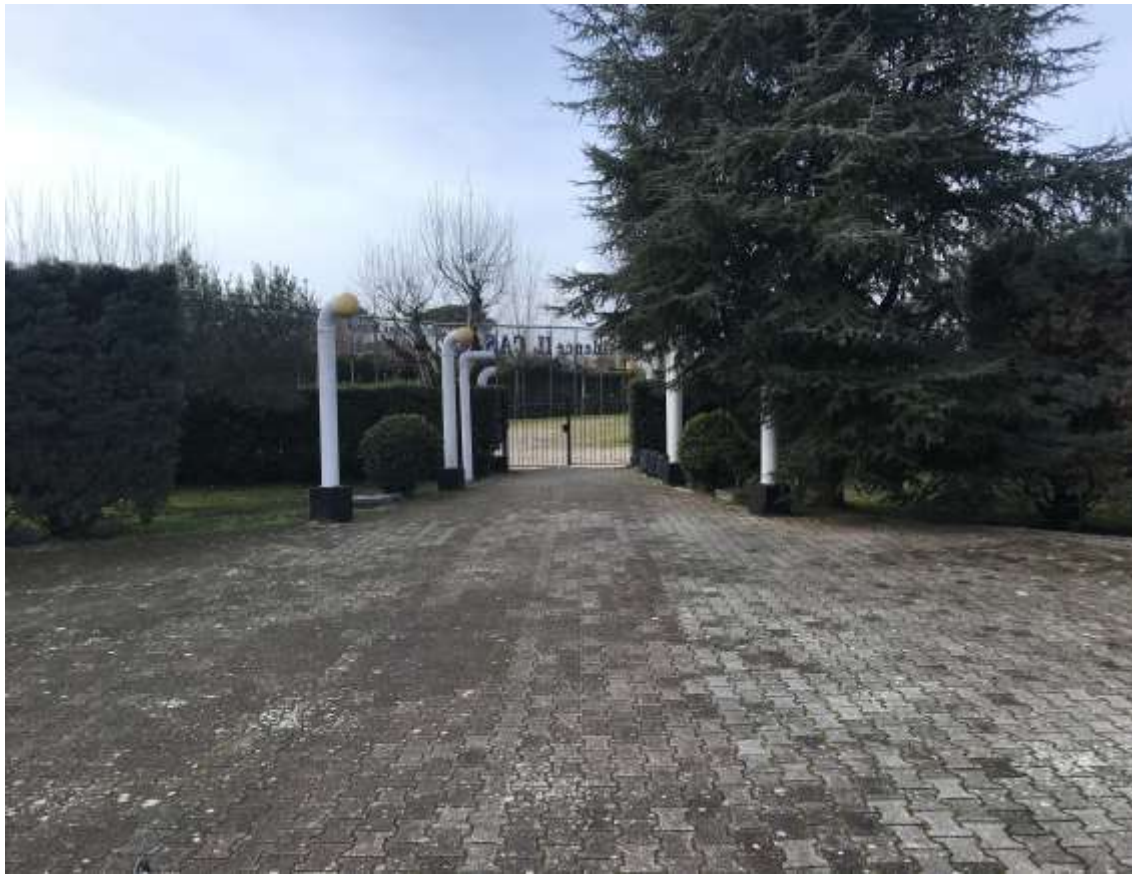
Figura 8. Verso ingresso al lotto