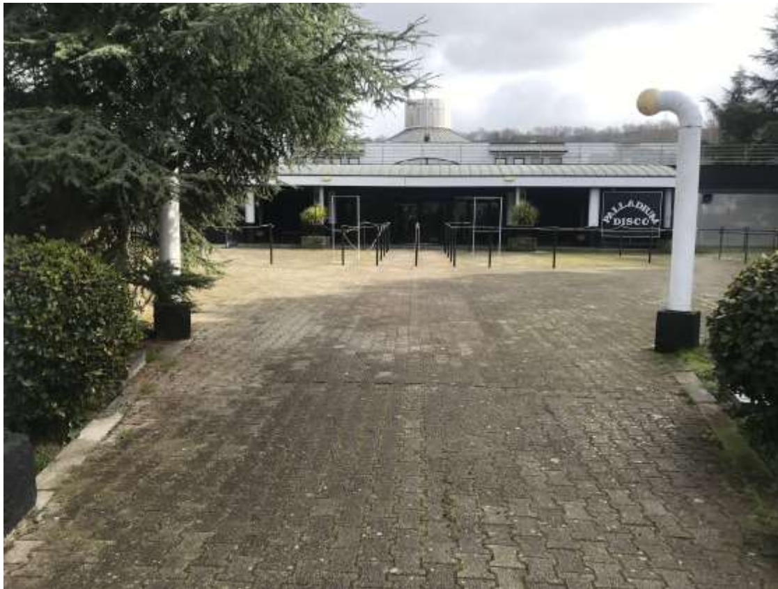
Figura 6. Ingresso discoteca