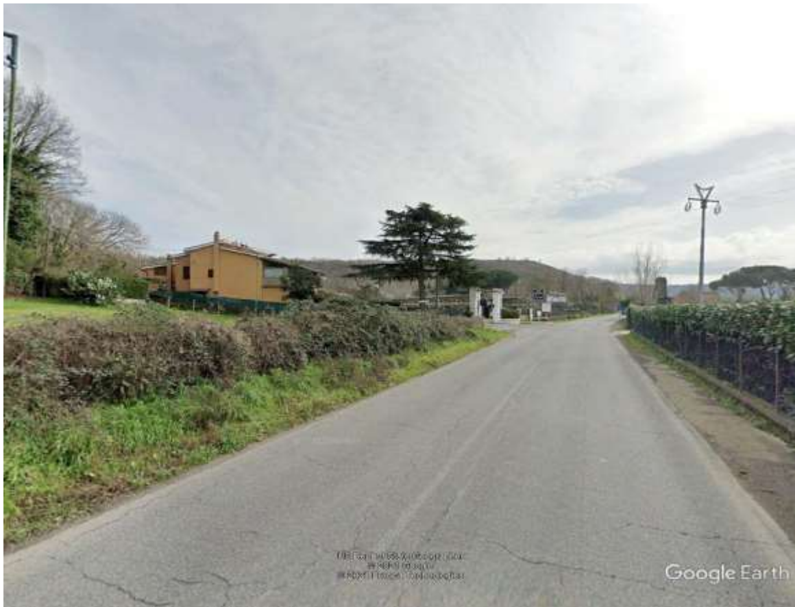
Figura 3. . Via dell'acquarella in direzione est