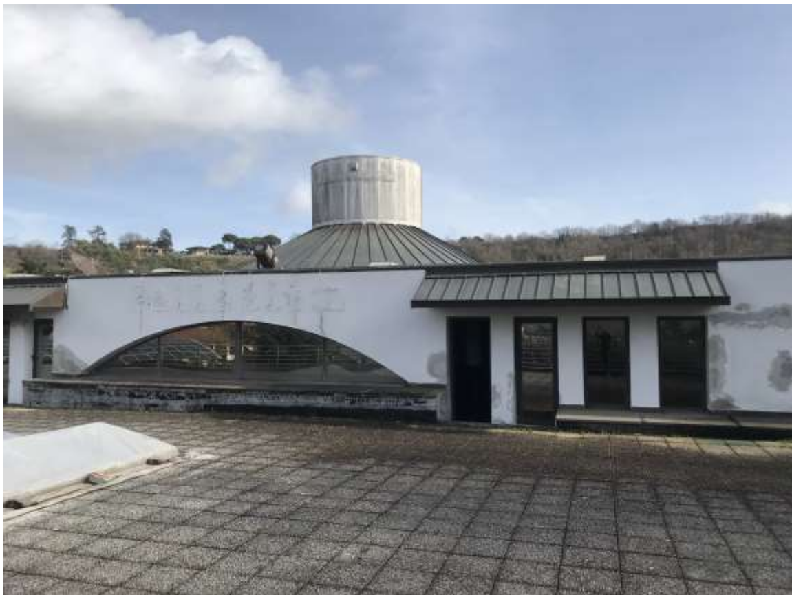
Figura 5 .copertura della discoteca