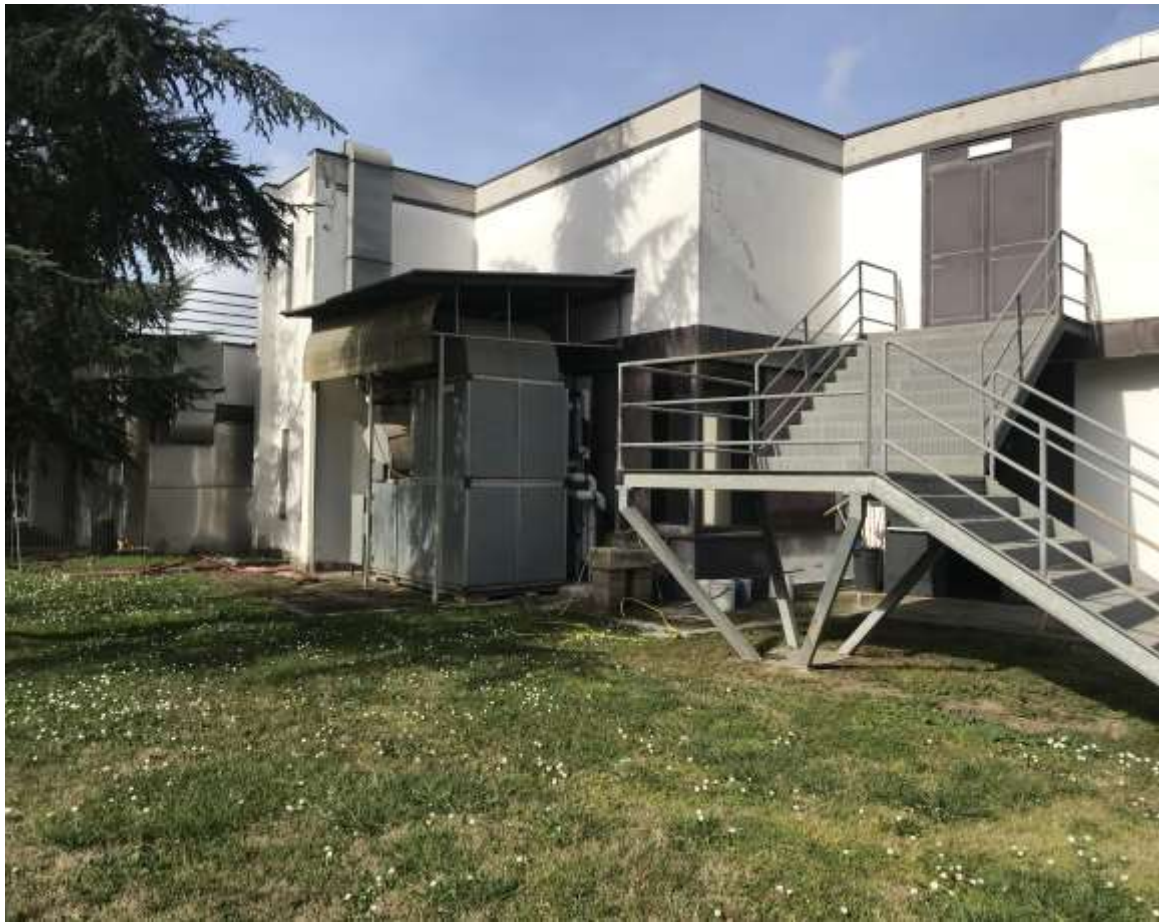
Figura 10. Lato sud della discoteca