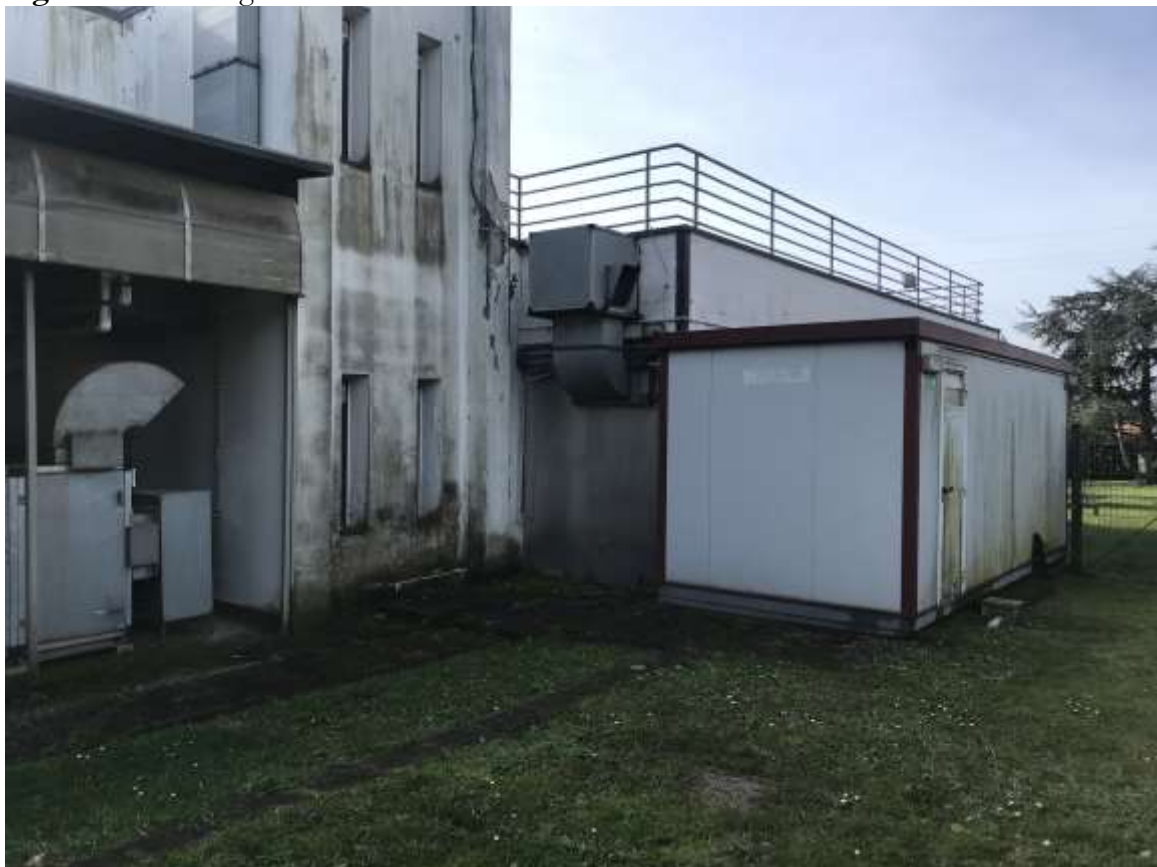
Figura 9. Il retro della discoteca