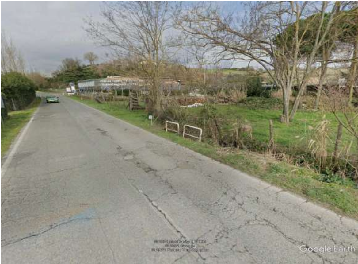
Figura 2. . Via dell'acquarella in direzione ovest