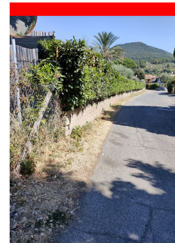
Muro Tufo fino h 1 m + Rete pali ferro fino a 1.4 m