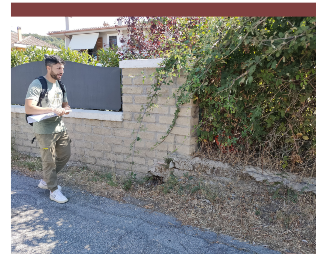
Muro Tufo con copertina cls fino h 1.8 m + ringhiera in ferro