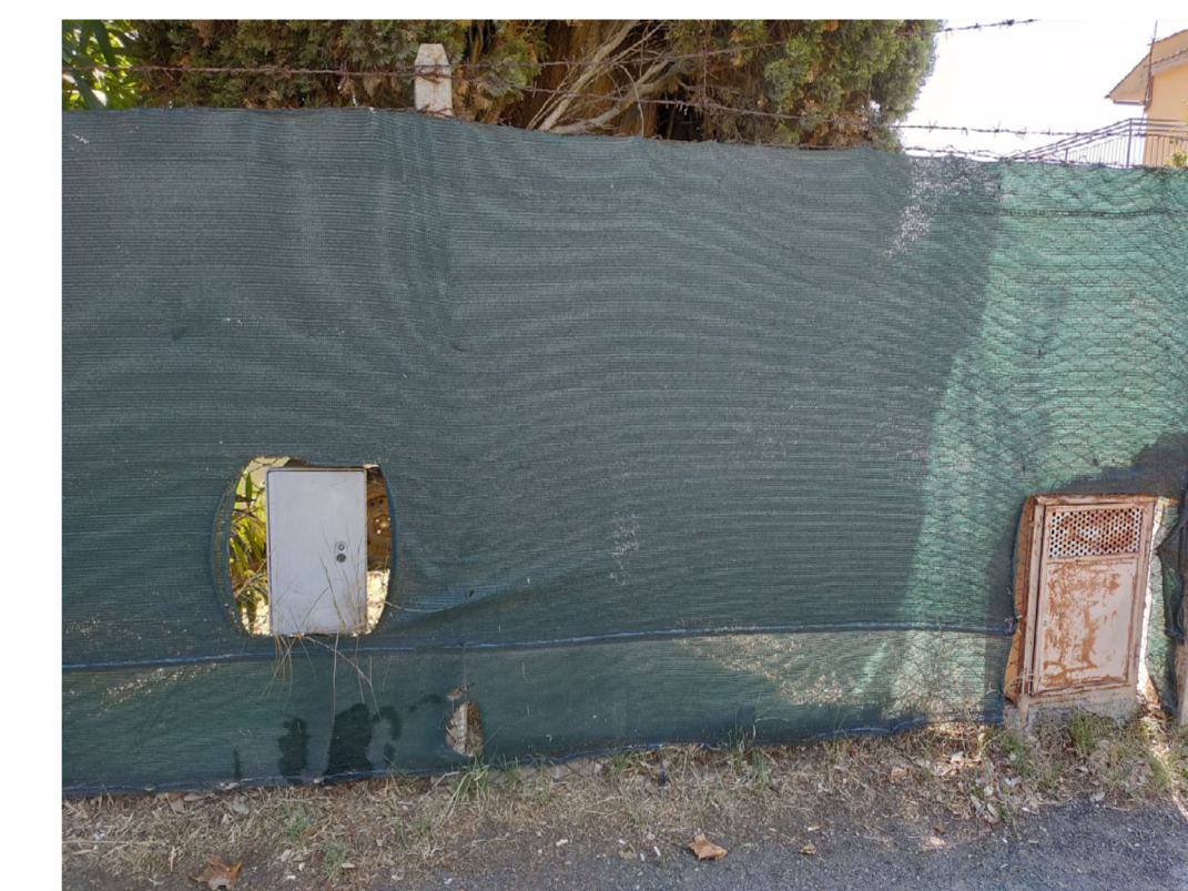
Rete con pali cls fino a h 1,8 m