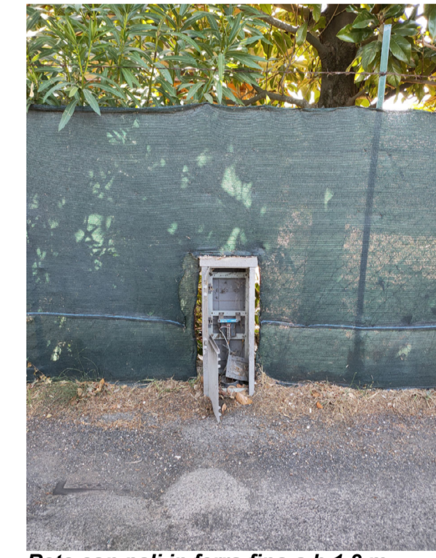
Rete con pali in ferro fino a h 1,8 m