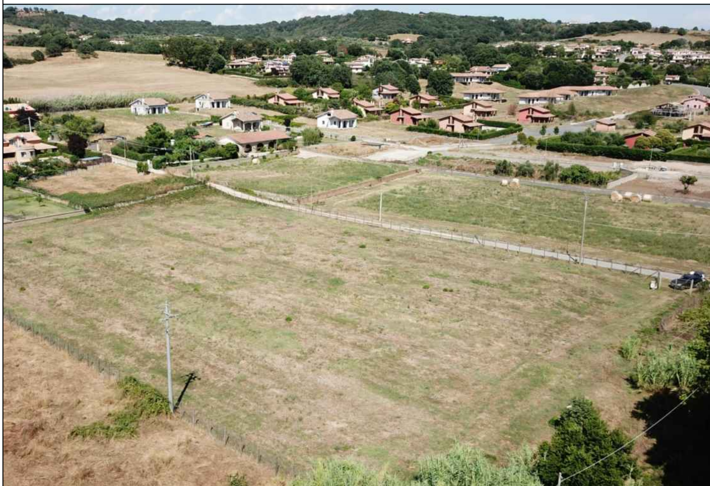
FOTO 2b - Inserimento dell'opera progettata nel contesto paesaggistico