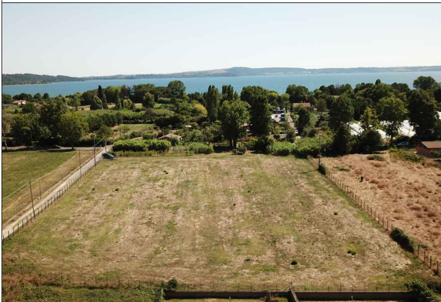
FOTO 1b - Inserimento dell'opera progettata nel contesto paesaggistico